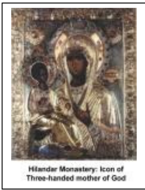
Hilandar Monastery: Icon of Three-handed mother of God